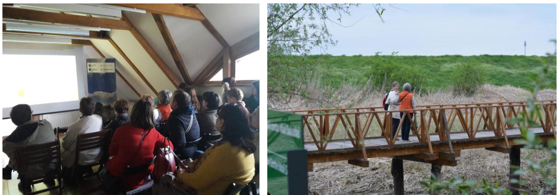
Slika 5. Sudionici 11. Simpozija HDZZ-a u posjetu parku prirode Kopački rit.

Za sve sudionike 11. simpozija organizirana su dva izleta na području Osječko-baranjske županije. Prvi je izlet bio obilazak grada Osijeka uz pratnju turističkog vodiča, dok je drugi izlet organiziran po završetku službenog dijela simpozija u Parku prirode Kopački rit gdje su sudionici simpozija slušali zanimljivo predavanje o Kopačkom ritu te su uživali u šetnji poučnom stazom.