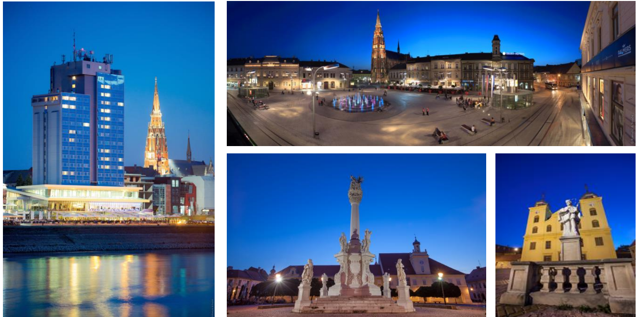
Slika 1. Panoramske slike grada Osijeka

Osijek, Hotel Osijek, 5. – 7. travnja 2017.