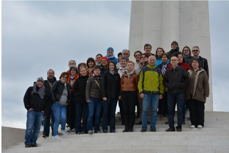
Slika 6. Dio sudionika 11. Simpozija HDZZ-a na spomeniku Batinskoj bitci u Batini.

Nakon posjeta Kopačkom ritu, i kraćeg zaustavljanja u Tikvešu, izlet je nastavljen prema Batini i spomeniku Batinskoj bitci, znamenito djelo hrvatskog kipara Antuna Augustinčića. Po završetku šetnje po Baranji druženje je nastavljeno u baranjskom mjestu Zmajevac u restoranu „Josić“ uz riblju večeru u tradicionalnom ambijentu.